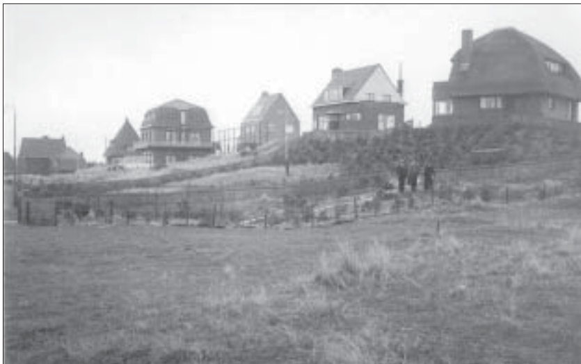
Een foto van de Duinweg, waarschijnlijk in de periode 1920/1930 gemaakt.