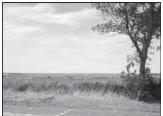
Grote gaten in het aanzicht van ons dorp