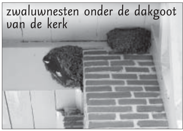
zwaluwnesten onder de dakgoot van de kerk

ZATERDAG elke 2e en 4e avond van de maand kurken