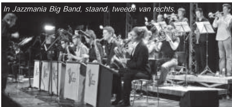
In Jazzmania Big Band, staand, tweede van rechts.