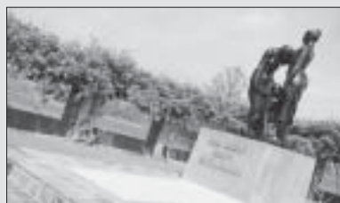
Jacky Ambriola Zagt

13 augustus, een zonnige dag. Vrouwen en kinderen staan buiten als houden ze er de wacht. Een vliegtuig komt laag overgevlogen. Hoofden worden opgericht, zijn nu niet meer gebogen. Mijn moeder zwaait, huilt en lacht ze staat dicht naast mij. Goddank, die ellendige oorlog eindelijk..... voorbij!