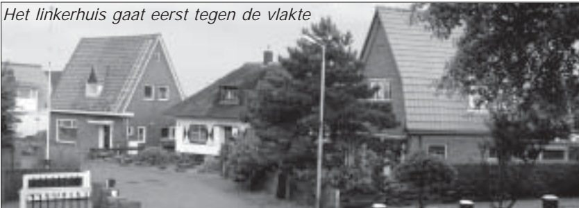
Het linkerhuis gaat eerst tegen de vlakte

Rieneke voelt zich betrokken bij het dorp en leeft met de inwoners mee, dus ze zal altijd wel actief blijven met hand- en spandiensten. We zullen haar dus gelukkig nog steeds vaak zien: overal waar ze nodig is!