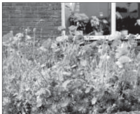
Kleur en fleur rond het Dorpsplein