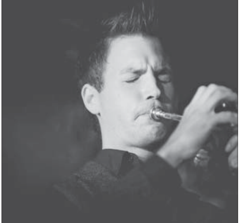
In Gumbo Jumbo, tweede van links