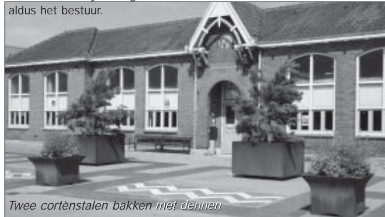
Twee cortènstalen bakken met dennen

„Deze dennen zijn niet goed dus er komen binnenkort nieuwe bomen!”, aldus het bestuur.